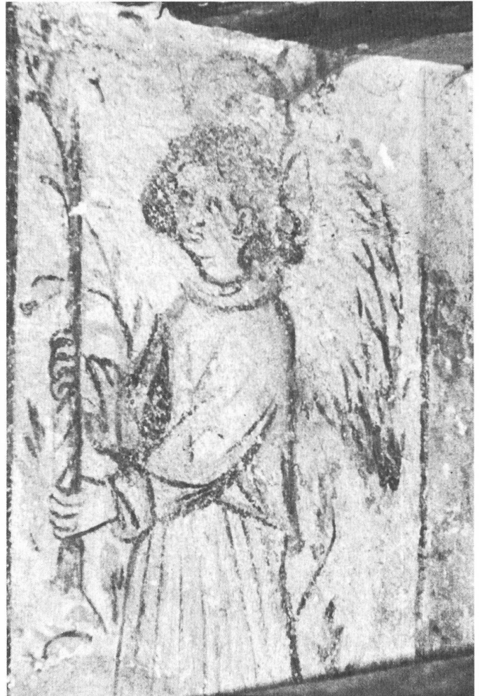
Fresko: Engel mit Leuchter