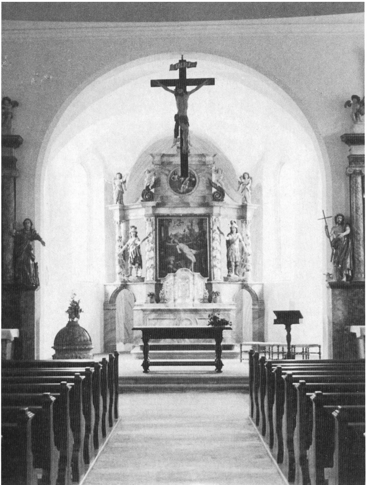
Pfarrkirche St. Laurentius, Rodersdorf: Im Licht barocker Schönheit zeigt sich der Hochaltar (Martyrium des hl. Laurentius, links und rechts die heiligen Urs und Viktor); im Hintergrund erkennbar der schwungvoll gemalte Vorhang.