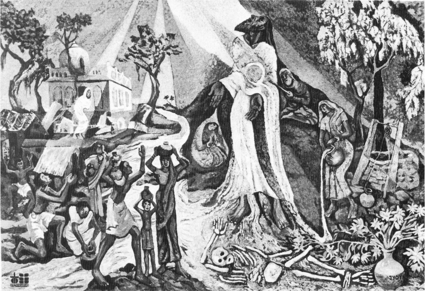
Das neue Fastenopfer-Hungertuch aus Indien.