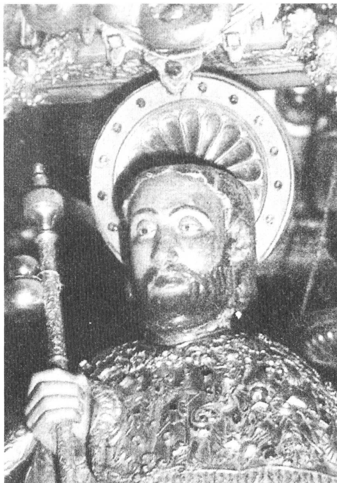
Statue des hl. Jakobus

Wir wissen, dass damals schon eine Wallfahrt bestand. Zwischen dem 9. und 11. Jahrhundert mussten die Pilger, die über die Pyrenäen kamen, immer wieder von der normalen Pilgerstrasse abweichen, wenn die arabischen Armeen gegen Norden vordrangen. Durch diese ganze vorgegebene Situation wurde die Wallfahrt nach Compostela notgedrungen in Verbindung gebracht mit der Rückeroberung Spaniens aus der Gewalt des Islam. So wurde der hl. Jakobus wegen dieser Verbindung von Wallfahrt und Rückeroberungskampf zum Patron der ganzen iberischen Halbinsel. So soll der hl. Jakobus dem König Ramirez erschienen sein und ihm versprochen haben, dass er am nächsten Morgen die Araber besiegen werde, obwohl alle Anzeichen gegen einen solchen Sieg