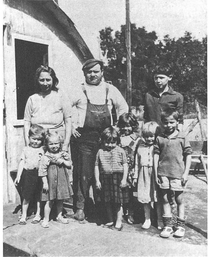
Slum von Noisy le Gran, wo die ATD Vierte Welt 1957 gegr undet wurde.