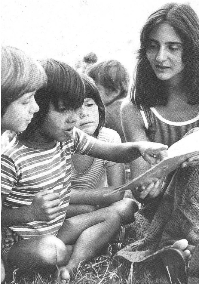
Strassenbibliothek (Aktion Wissen teilen).

ins Schweizerische Zentrum der Bewegung. Dort können Mann und Frau, Eltern und Kinder einander neu entdecken, ihre Fähigkeiten entfalten und so ihre Hoffnung für die Zukunft stärken. Sie nehmen damit teil am Kampf der Bewegung, dass alle Familien als Familien zusammenleben und auch gemeinsam in die Ferien gehen können.