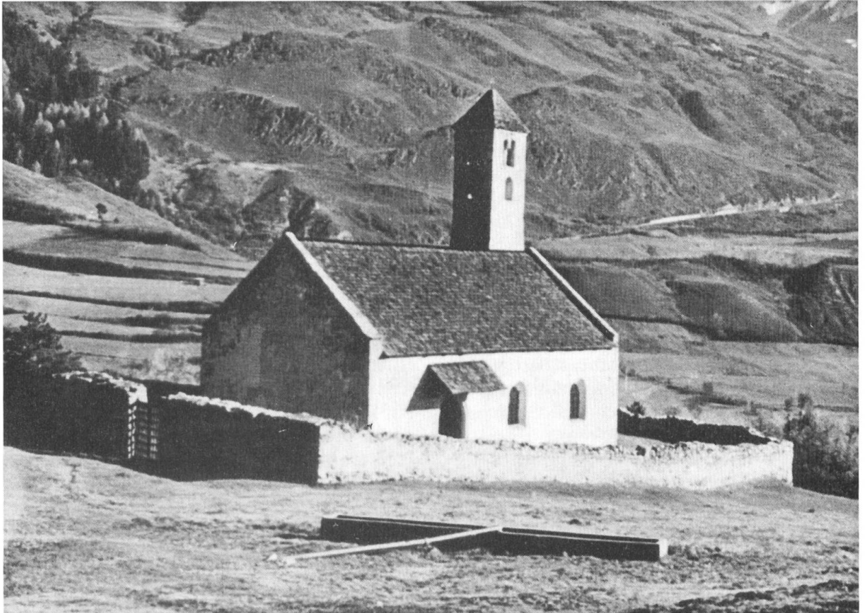
Kirche zum hl. Veit auf dem Tartscher Bühel (altromanisch).

danke schon im Ansatz falsch liegt, ebenso unrichtig etwa wie es die Frage eines Seelsorgers wäre, was ihm denn davon bleibe, anderen Leuten Mut, Trost und Zuversicht zugesprochen zu haben. Warum ist ein solcher Gedanke vollständig abwegig?