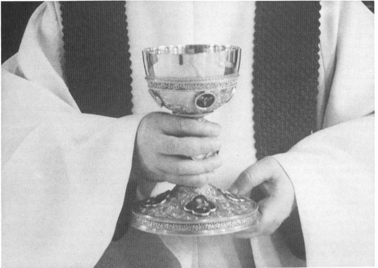
«Wir bringen diesen Kelch vor dein Angesicht, damit er uns der Kelch des Heiles werde» (Foto: P. Notker Strässle).

gung jeglicher Art und im Feiern der Gottesdienste – meinen Beitrag als Christ, als Benediktiner und als Priester, dass Sein Reich kommt (vgl. Vaterunser)!