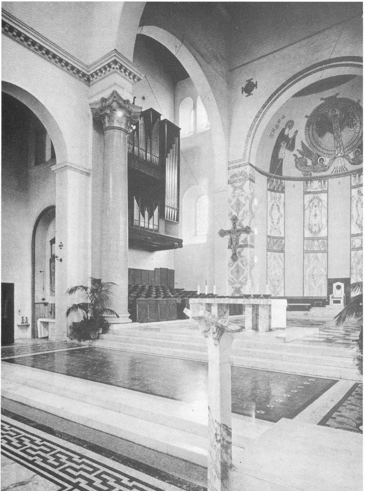
279 Kirche der Primazialabtei S. Anselmo, Rom.