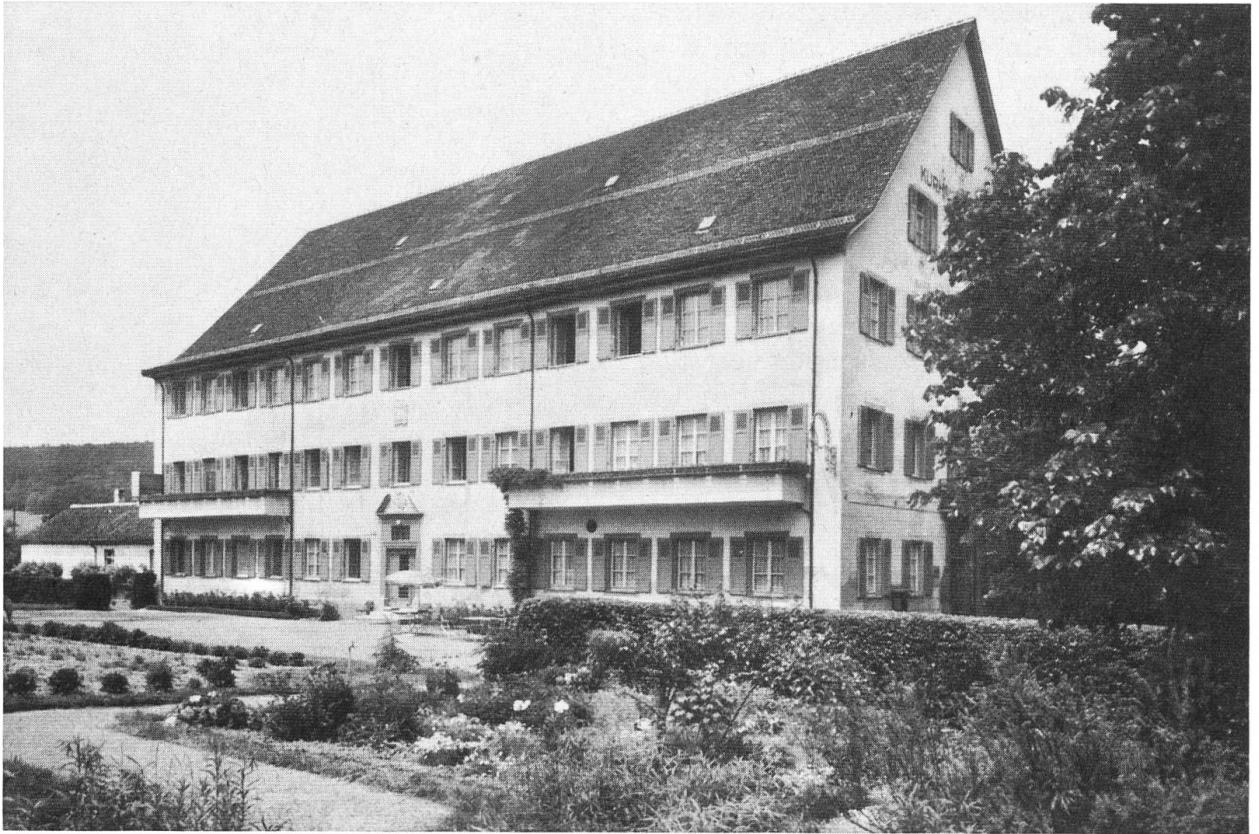
Das Kurhaus Kreuz mit den 1936 eingebauten Balkonen.

Erholungssuchende, Rekonvaleszente und ältere Menschen. Besonders für unsere Schwestern ist es wegen seiner Nähe zur Wallfahrtskirche zu einem immer beliebteren Ferienort geworden.