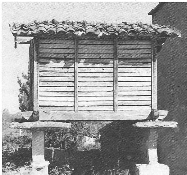
Horreo am Weg.

Als letztes Dorf auf unserem Pilgerweg möchte ich Puertomarin erwähnen. Das alte Dorf, das früher am Ufer des Minho lag, wurde wegen eines geplanten Stausees auf den Berg verlegt. Bei niedrigem Wasserstand kann man die Mauerreste der alten Pilgerbrücke aus dem Jahre 1120 sehen. Das Juwel Puertomarins, die romantische Wehrkirche des Santiagoritterordens aus dem 12. Jahrhundert, hat man Stein für Stein abgebaut und auf der Höhe wieder errichtet. Obwohl Puertomarin über ein Pilgerhospiz verfügt, bevorzugten wir es, in unserem Zelt zu übernachten. Wegen seltenem Regen kann man die Landstrasse, welche sich durch die Stadt zieht, und den Stadtpark nicht richtig voneinander unterscheiden. Staub, Steine und Sand waren überall zugegen. Dennoch, so schien es uns, hatten wir den Standplatz unseres Zeltens nicht sehr günstig gewählt. Gerade als wir mit unserem Abendessen beginnen wollten, fuhr der Bürgermeister bei unserem Zelt vor undklärte uns dar-