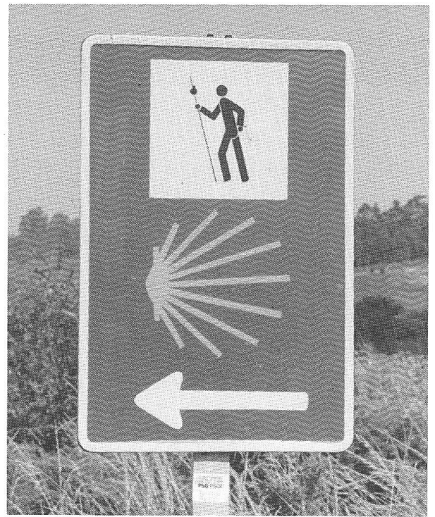
Beschilderung des Santiagoweges.

Doch das grösste Problem, welches uns auch später immer wieder zu schaffen machte, war nicht ein unbequemes Nachtlager, sondern vielmehr die schon am frühen Morgen stechend heisse Sonne. Hitze und Sonne hin und her, wir wollten so schnell als möglich Astorga erreichen und machten uns entschlossen auf den Weg. Durch ganz Spanien ist der Jakobusweg mit Hinweisschildern «Camino de Santiago» ausgeschildert. Sofern es die geographischen Gegebenheiten zulassen, verläuft der Weg nach dem «Camino Antiguo», dem mittelalterlichen Pilgerweg. Ausgerechnet die erste Strecke von León nach Astorga muss der Fusspilger auf einer belebten Hauptstrasse zurücklegen, welche hier mit dem Camino Anti-