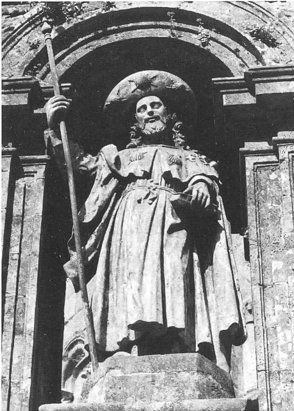
Der heilige Jakobus.

gennahme am Ölberg. Nach den Überlieferungen des hl. Hieronymus (390) soll er bald nach dem Tod Christi in der weit entfernten römischen Provinz Hispania (Spanien) missioniert haben. Er folgte damit dem Missionsruf Jesu: «Gehet hinaus in alle Welt und lehret alle Völker.» Er und Johannes waren die Eifrigsten in der Ausführung dieser Botschaft, weshalb es als wahrscheinlich gilt, dass er bereits vor der Überführung der Reliquien nach Santiago in Spanien war. Als er nach seiner Missionstätigkeit nach Jerusalem zurückkehrte, wurde er von den Gläubigen in einen Rang erhoben, der dem eines Bischofs entspricht. Diese Tatsache veranlasste Herodes Agrippa I., ihn im Jahre 44 n. Chr. enthaupten zu lassen. So wurde der hl. Jakobus zu einem der ersten Märtyrer des Christentums.