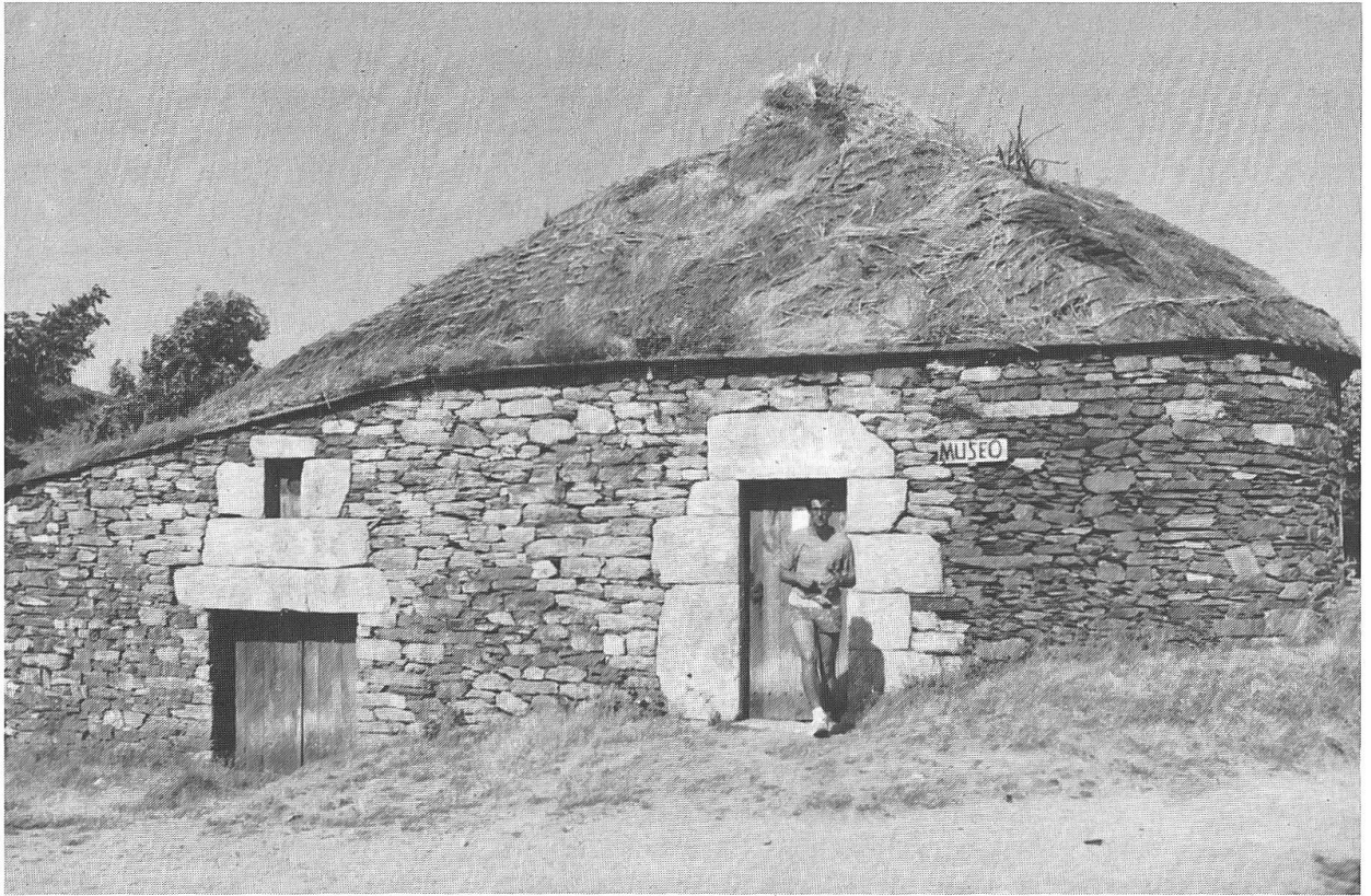
Haus in Cebreio.

gerreise ist, hin zu Gott – zum Brunnen des lebendigen Wassers.