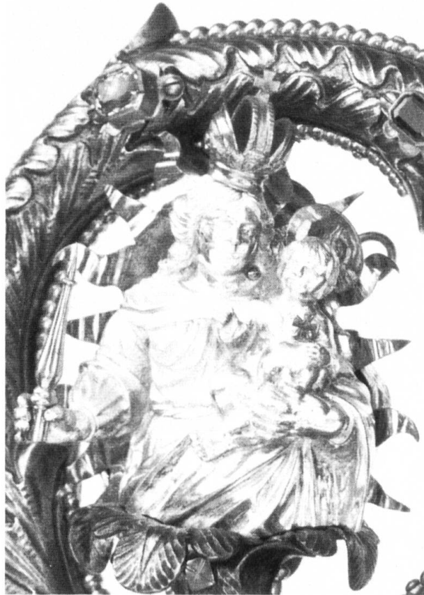
Die gekrönte Gottesmutter mit Zepter und Kind.