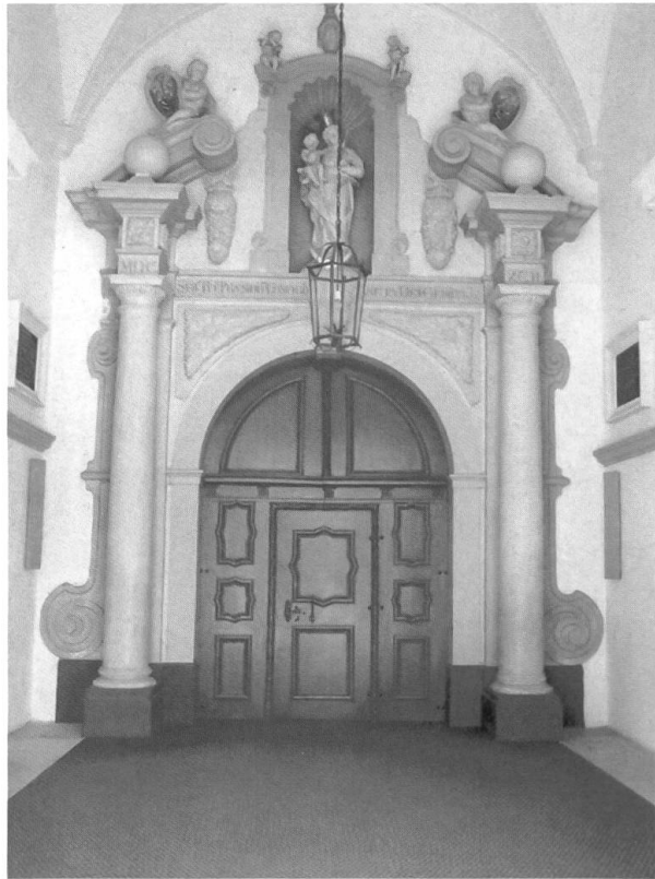
Kirchenportal, 1692, geschaffen von Steinmetz Peter Fetzel von St. Gerold im grossen Walsertal.

1691 verdingte Abt Augustin Reutti das grosse Kirchenportal an Meister Peter Fetzel, Steinmetz von St. Gerold im grossen Walsertal. Zwischen 1679 und 1700 stifteten einige Äbte von Schweizer Klöstern die verschiedenen Altarbilder.