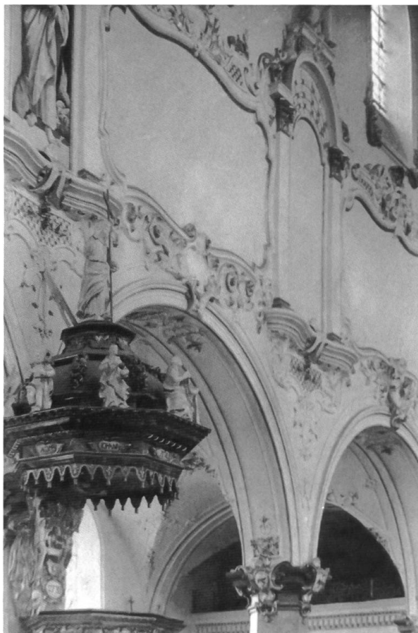
Kirche, 1906, im neobarocken Gewand, Ausführung: Atelier für Stuck, Carl Schmidt-Frey und Söhne, Zürich.