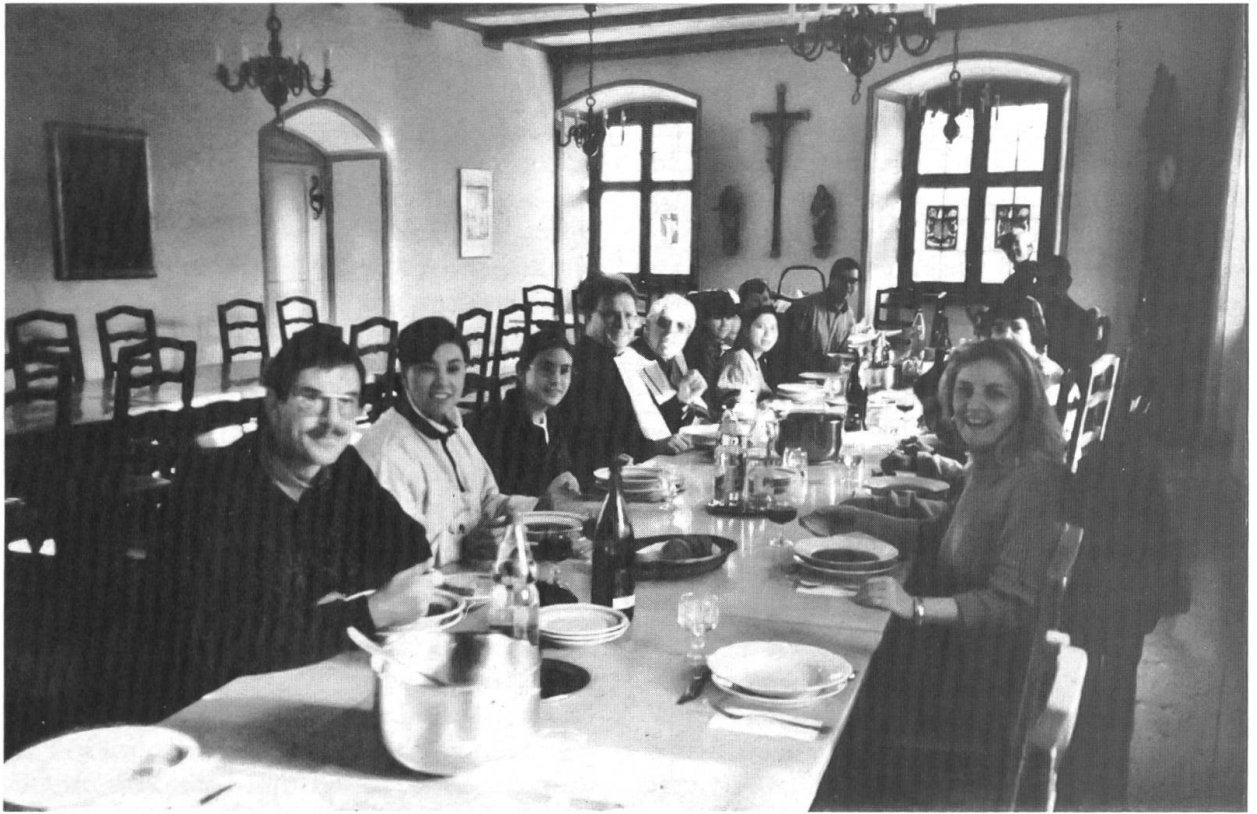
Eine muntere Gästeschar in unserem Gästespeisesaal.

fach, um genügend Zeit zu haben, miteinander zu reden. Neben «treuen Kunden» kommen immer wieder neue dazu.