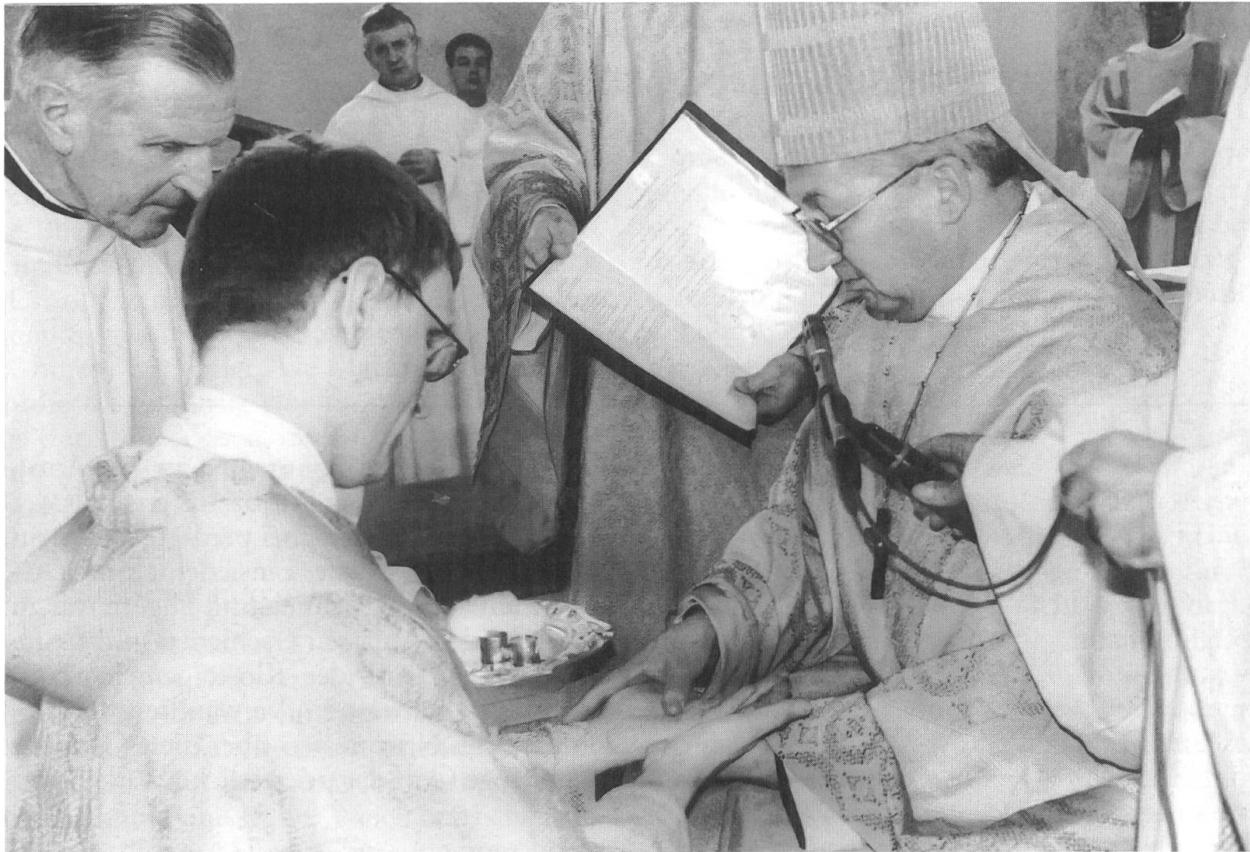
Der Bischof salbt dem Neupriester die Hände mit Chrisam.