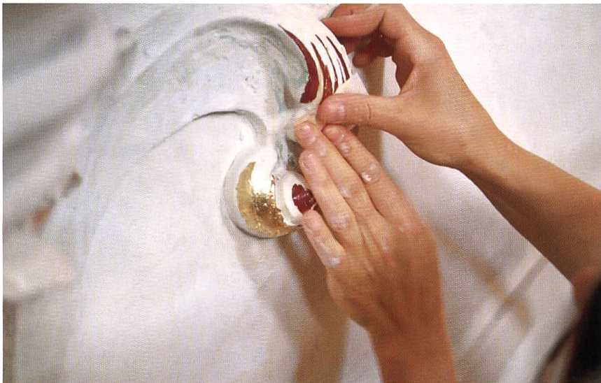
Beim Vergolden der Stuckaturen: Auf die mit roter Spezialfarbe behandelten Teile wird eine hauchdünne Goldschicht aufgetragen.