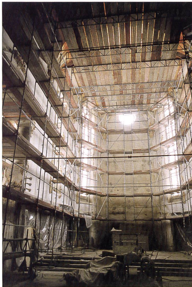
In der ersten Etappe wurde der Hochaltar abgebaut und der Chor der Kirche vollständig eingestrichelt.

Schwierig war es, für die Fassung der Beichthäuser die richtige Entscheidung zu treffen. Die «originalen» Stücke stammen aus der Mitte des 19. Jahrhunderts, sind aus Holz (Tanne) und waren klassizistisch gehalten. Bei der Renovation der Kirche von 1900 wurden sie dem neuen Raumempfinden angepasst und mit barocker Zierart aus Gips versehen. Die mannigfaltige Farbschichttreppe erleichterte die Entscheidung nicht. Die Palette reichte von einer Holzmaserierung über eine Marmorierung in grün-blau und einer grauen Steinfas-