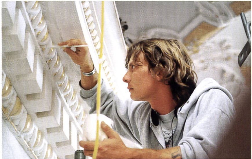
Beim Ausmalen an der Brüstung der Orgelempore.