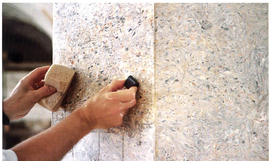
Der Stuckmarmor der Säulen musste in einem aufwändigen Verfahren mehrmals poliert werden.