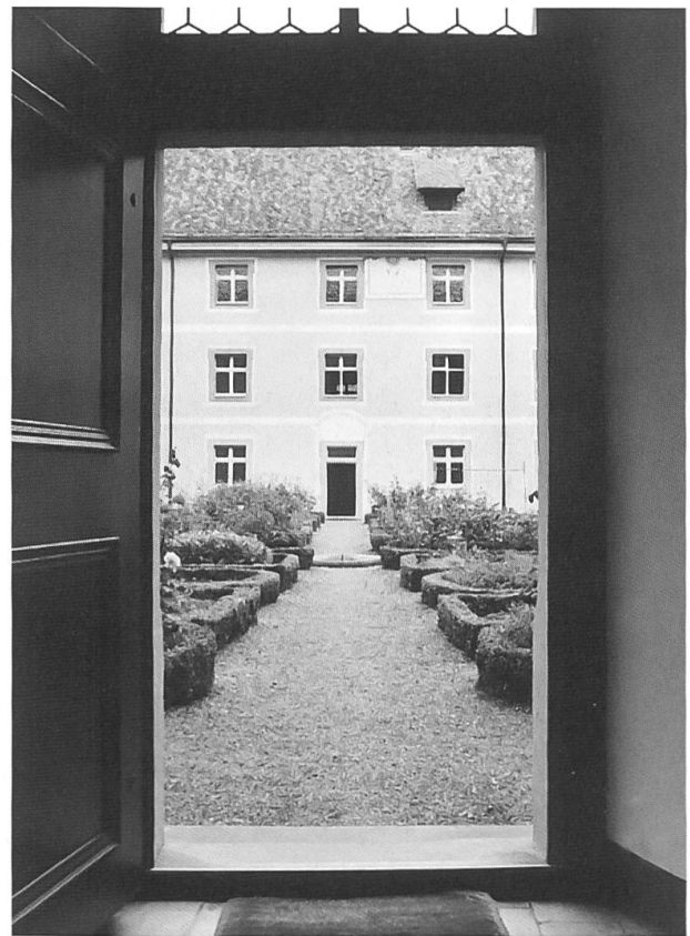
Kloster Fahr: Blick in den Innenhof (Kreuzgang), der den Klosterfrauen als Kräutergarten dient.