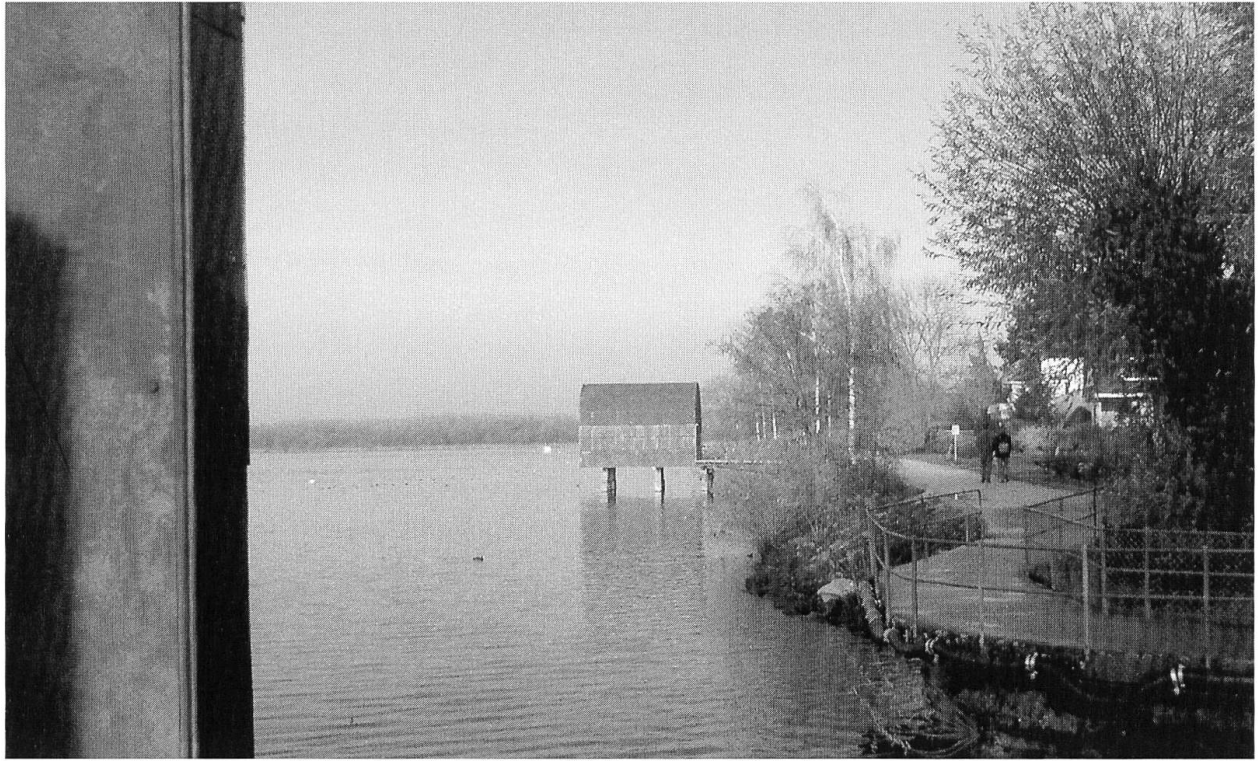
«Un ange passe» auf der Expo.02 am Seeufer von Murten (oben). Der letzte der sieben «Räume des Glaubens» auf Stelzen beherbergte die gelben schreienden Esel – Sinnbild der leidenden Kreatur, die noch auf ihre Erlösung wartet (unten).