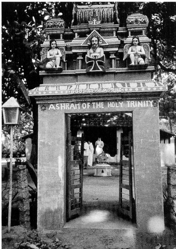
Eingang zum Ashram mit Blick zur Kapelle. Über dem Tor beten zwei Engel die Dreifaltigkeit an, dargestellt mit dreifachem menschlichem Antlitz.

Da stand ich nun im «Wald des Friedens» – das meint Shantivanam . Das Brummen der zwölfstündigen Busfahrt noch in den Ohren, umgab mich hier sogleich eine grosse Stille, die trotz der tropischen Nachtgeräusche und durch das Rascheln in den Kronen der mächtigen Kokosnusspalmen und Bananenstauden geradezu greifbar wurde. Ein Jüngling namens