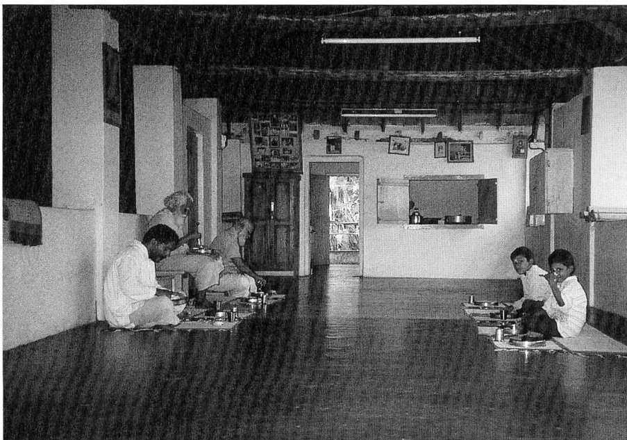
Blick in den Essraum des Ashram