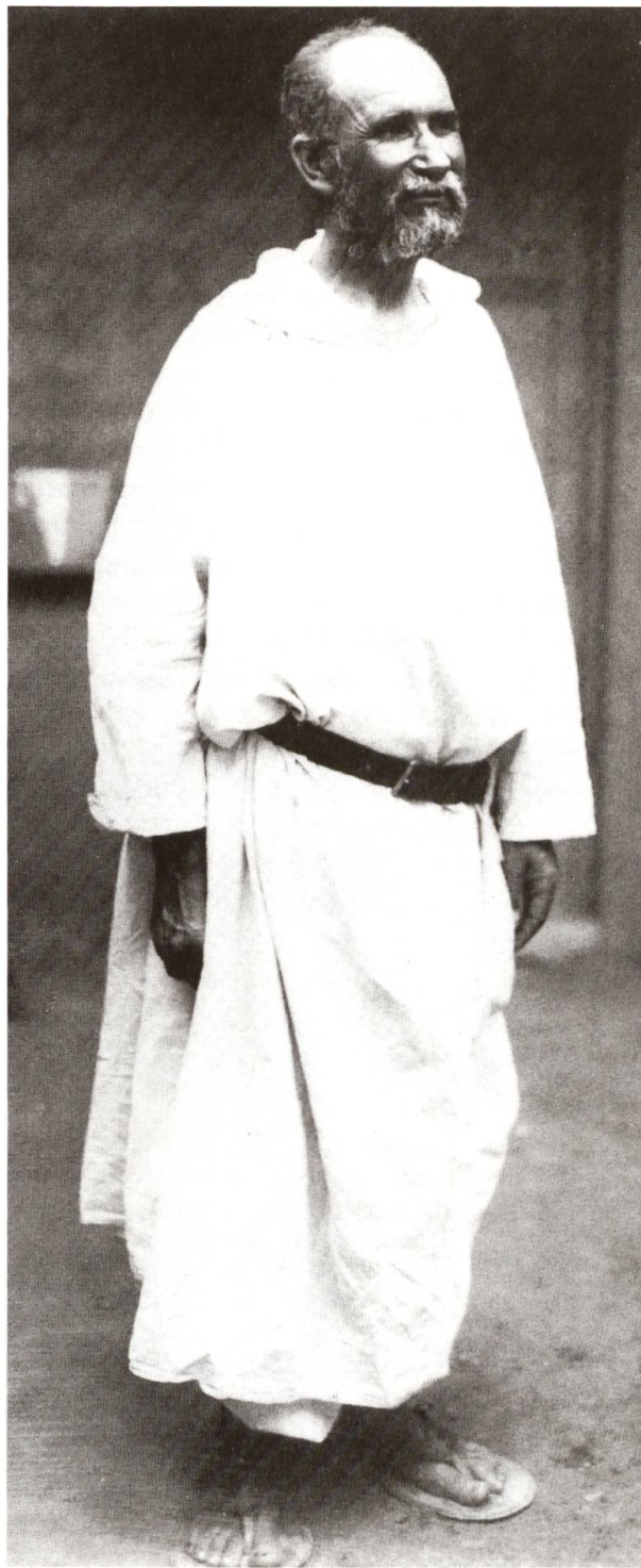
Bruder Karl von Jesus in Tamanrasset im Herzen des Hoggar in der südlichen Sahara. Dorthin übersiedelte er 1905. Für die dort lebenden Tuareg wurde er zu einem wahren Freund und zu einem «Marabut, Diener des einen Gottes» (es ist die letzte Fotografie von Charles de Foucauld, aufgenommen im Jahr 1915).

Im konkreten Alltag so zu leben, ist aber nur aus einer ganz tiefen Verbundenheit mit Jesus heraus möglich. Bruder Karl hatte gelernt, sie in jeder Situation beizubehalten und jeden Brief, jedes Gespräch, ja alles mit einer «geistlichen Kommunion» zu beginnen. Zudem ist er fest überzeugt, dass der in der Eucharistie anwesende Herr nicht unwirksam bleibt, sondern seine gnädige Zuwendung auch «ausstrahlt» in die ganze Umgebung. Er selbst, Bruder Karl, ist als sein Priester nur eine Art Mittelsmann, der die eucharistische Präsenz