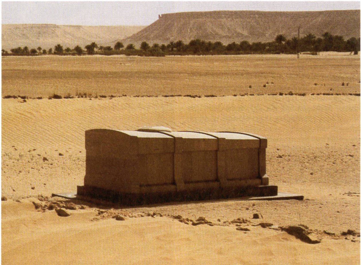
Die Lebenshingabe von Charles de Foucauld, vollendet am 1. Dezember 1916 in der Wüste von Tamanrasset, hat vielfältige Frucht hervorgebracht. Sein Grabmal befindet sich in El Golea, einer grossen Oase rund 650 km südlich von Algier.

Am 1. Dezember 1916 beendet eine Schar senussistischer Rebellen bei einem Überfall das Erdenleben Bruder Karls. Er fällt wie das Weizenkorn in die karge Erde – doch die Frucht blieb nicht aus. Viele versuchen auf unterschiedlichen Wegen, in unserer zunehmend glaubensfernen Umgebung oder unter Andersgläubigen ihren Glauben so «weiterzureichen», wie er es vorgelebt hat.