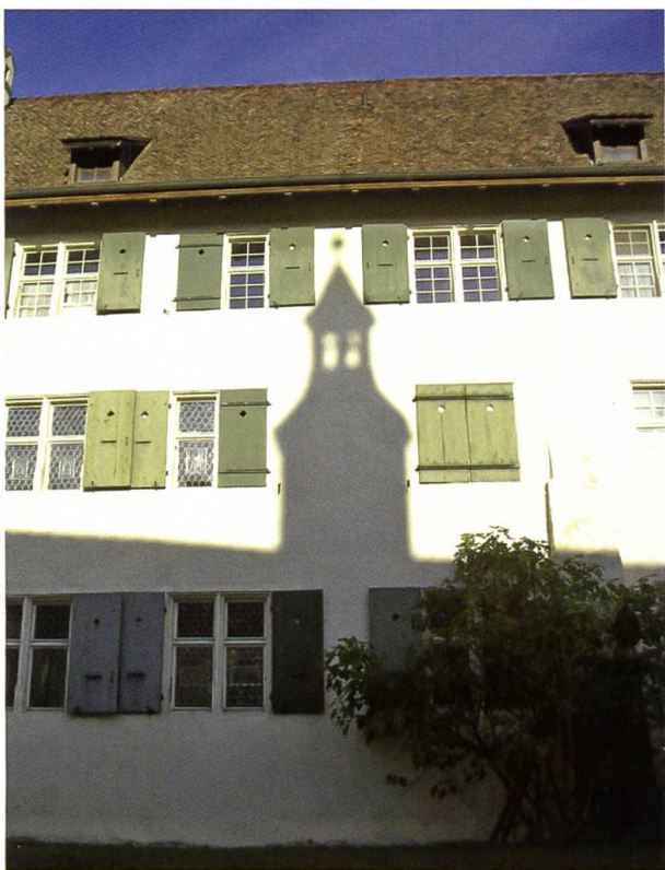
Ein Blick mit Einblick: Die Ostfassade des Mariasteiner Konventbaus (nördliche Hälfte), vom Gästehaus her gesehen, mit dem Schatten des Dachreiters der Siebenschmerzenkapelle.

sein. Wir verhalten uns ruhig, wollen nicht stören. Beinahe bewegungslos steht er dort. Eine Fledermaus flattert vorbei, ein Käuzchen heult. Es wird kühler, ein warmer Tag geht zu Ende, und auch uns ziehts ins Bett. Ganz leise machen wir uns auf den Weg, befürchtend, den Mönch in seiner Ruhe zu stören. Langsam nähern wir uns ihm, bleiben vor der Tür stehen, unsere Augen versuchen angestrengt, ihn in der Dunkelheit zu erkennen ... doch in dem Moment stellt sich heraus: Der vermeintliche Mönch ist nichts anderes als ein Busch!