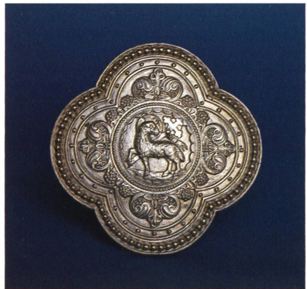
Paxtafel (19. Jh.), Kloster Mariastein

zweckmässig ist, diese Geste, die übertriebene Formen annehmen und ausgerechnet unmittelbar vor der Kommunion Verwirrung stiften kann, in Grenzen zu halten». Und er erinnert daran, «dass der grosse Wert der Geste mitnichten geschmälert wird durch die Nüchternheit, die notwendig ist, um ein der Feier angemessenes Klima zu wahren; man könnte zum Beispiel den Friedensgruss auf die beschränken, die in der Nähe stehen». In einer Anmerkung erwähnt der Papst, dass er die zuständigen Stellen angewiesen habe, «die Möglichkeit zu prüfen, den Friedensgruss auf einen anderen Zeitpunkt zu verlegen, zum Beispiel vor den Gabengang». Damit würde