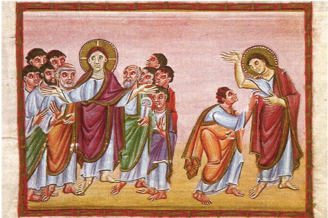
«Friede sei mit euch!» (Joh 20,19 und 26) Am Osterabend grüsst der Auferstandene seine Jünger (links) und zeigt acht Tage später (rechts) auch dem Apostel Thomas seine Wundmale (Evangeliar Ottos III., Ende 10. Jh., Bayer. Staatsbibliothek, München).

Das Geschenk des österlichen Friedens an die Jünger enthält den Auftrag, hinauszugehen in alle Welt und das «Evangelium des Friedens» (Eph 6,15) zu verkünden. Der Name «Christ» umfasst grundsätzlich die Aufgabe, Frieden zu schaffen: «Selig, die Frieden stiften, denn sie werden Söhne (und Töchter) Gottes genannt werden» (Mt 5,9). Gemeint sind alle, die sich einsetzen für den Frieden in ihren Lebenskreisen, in Ehe und Familie, unter Bekannten und Freunden und überall, wo mitten im Streit Versöhnung das Ziel ist.