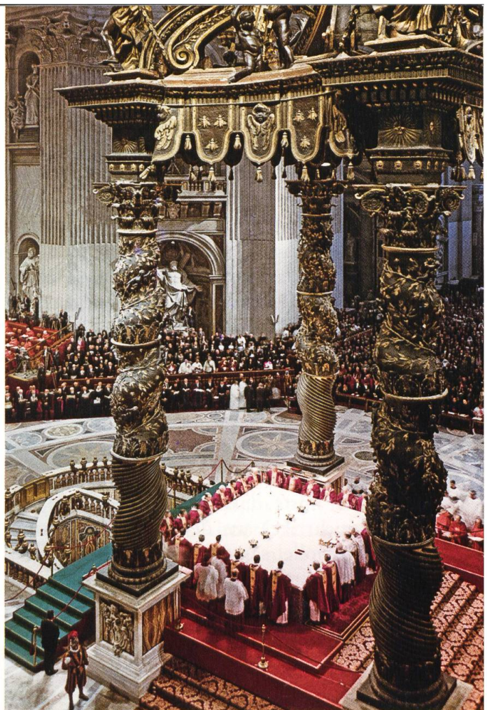
Zweites Vatikanisches Konzil: Konzelebration während der dritten Sitzungsperiode (1964).

Im April und wieder im August 1964 war in unserem Konsil & Kapitel die Frage aufgeworfen worden, welche Forderungen wollen wir an den Staat Solothurn stellen, wenn das Kloster wieder hergestellt wird. Man meint, nicht zu hohe Forderungen stellen zu sollen. Ich betone immer, dass wir nicht von uns aus feste Zusagen geben dürfen, dass wir die Angelegenheit Rom unterbreiten müssen. Es handelte sich doch um Raub von Kirchengut & darauf ist Exkommunikation! Wir können nicht von uns aus eine grosszügige Condonation gewähren.