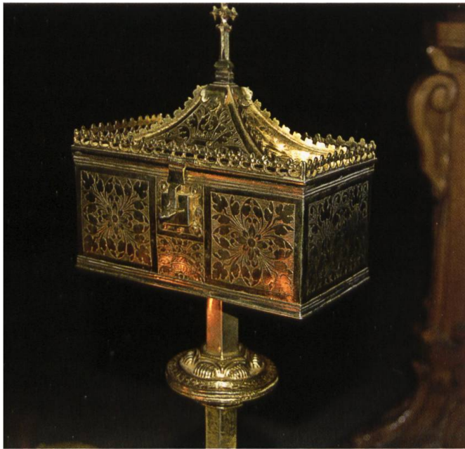
Reliquiar mit Reliquien des heiligen Benedikt in Mariastein.