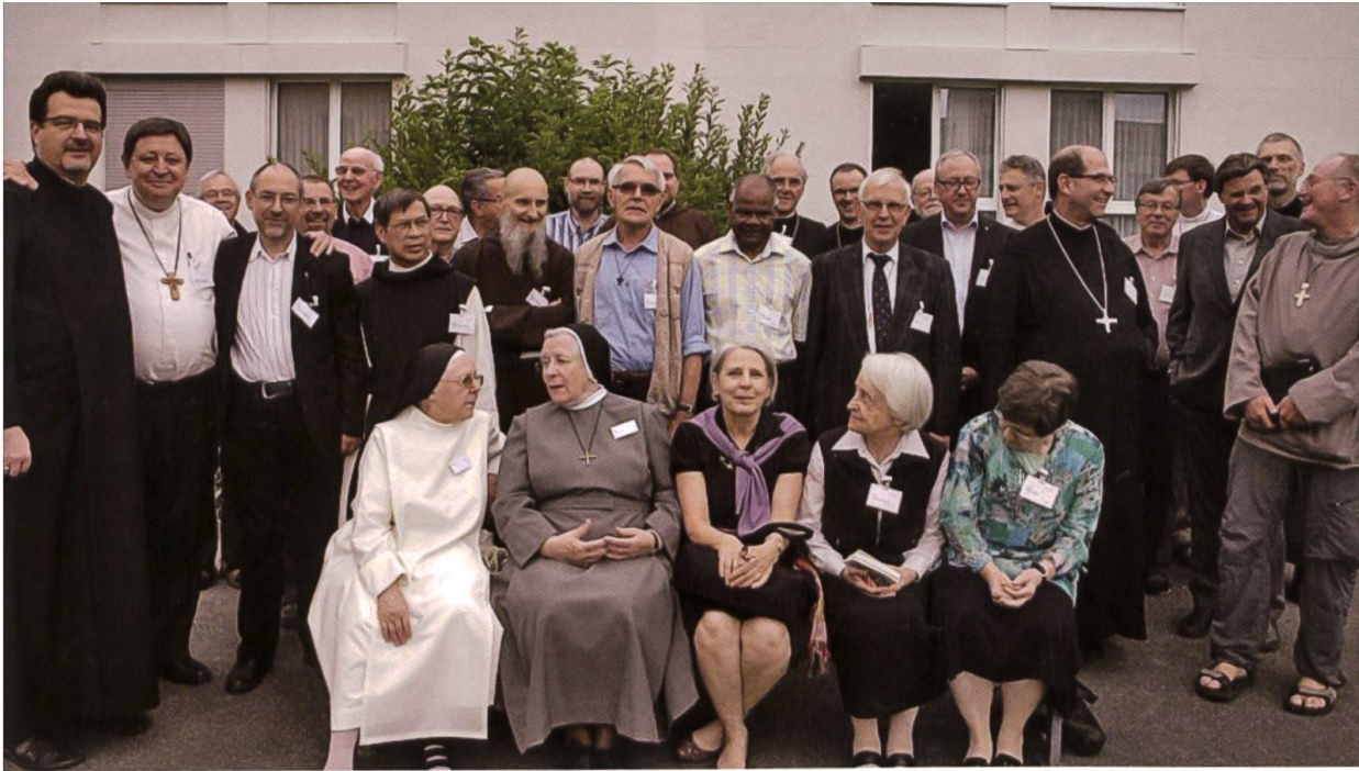
Grosser Ordenstag für die Deutschschweiz in Baar ZG am 23. Juni 2015. Oben: Gruppenfoto mit den Teilnehmern und Gästen der Generalversammlung der Vereinigung der Ordensoberen in der Schweiz (VOS'USM). Unten: Als Präsident der VOS oblag es Abt Peter, den Kurienkardinal und Präfekten der römischen Kongregation für die Orden, Kardinal João Braz de Aviz, vor den 600 Ordensleuten zu begrüssen.