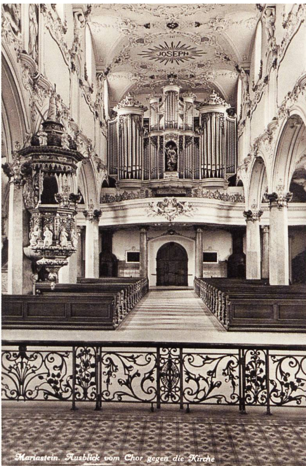
Undatierte Postkarte von der Klosterkirche, wie sie während des 1. Weltkriegs ausgesehen hat. Deutlich ist zu sehen, dass die Bildfelder an der Decke und in den Obergaden damals noch nicht ausgemalt waren. Rechts unten: Feldpostkarte aus dem 1. Weltkrieg.