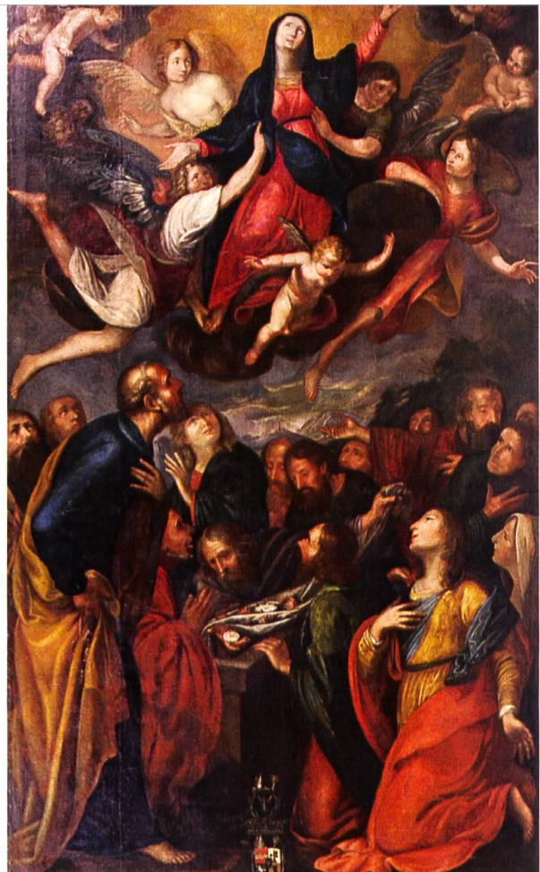
Hochaltarbild für Mariä Himmelfahrt (15. August) in der Klosterkirche Mariastein.

Weitere Informationen und Anmeldeunterlagen sind an der Klosterpforte erhältlich (Tel. 061 735 11 11).