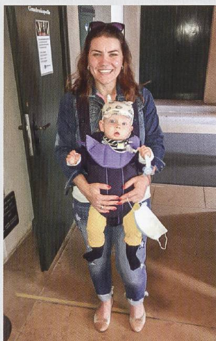
Freude und Dankbarkeit: Besucherin mit Baby nach der coronabedingten Schliessung.

Am Sonntag, 19. Juli 2020, 15.00 Uhr, war es endlich wieder so weit: Nach über viermonatiger Schliessung wurde die Gnadenkapelle wieder geöffnet, vorerst nur an Sonn- und Feiertagen von 15.00 bis 17.30 Uhr. Bereits um 14.50 Uhr sammelte sich eine Gruppe von Pilgern erwartungsfroh vor der Tür zur Gnadenkapelle und wartete auf die Türöffnung, natürlich korrekt mit Gesichtsmaske versehen. Unter den Pilgern war auch eine junge Mutter aus Basel; ihr Bube, am 29. November 2019 zur Welt gekommen, war wohl der jüngste Gast bei der Muttergottes an jenem Sonntag. Abt Peter von Sury