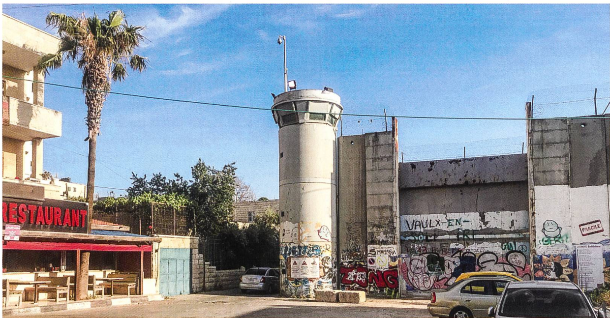
Trennmauer zwischen Israelis und Palästinensern beim Rahel-Grab am Ortseingang von Bethlehem.

nerlei soziale Absicherung ausser ihrer Familie haben, ist die Situation eine Katastrophe. Der Besuch in der Geburtsbasilika war natürlich ein ganz besonderer. Zwei orthodoxe Popen und zwei palästinensische Polizisten beäugten meine einsame und intensive Betrachtung der wunderbar restaurierten Fresken und Wandmosaiken. Die Mosaiken an der Wand der justinianischen (im Wesentlichen schon konstantinischen) Basilika aus dem 4. und 6. Jahrhundert (das ist der älteste noch vollständig erhaltene Kirchenbau im Heiligen Land) stellen die ersten Konzilien der Kirche dar, auf denen die Kirchenführer erst einmal formulieren mussten, inwiefern der in Bethlehem geborene Messias wahrhaft Gott und wahrhaft Mensch sein kann. Meine Aufmerksamkeit zogen auch die Malereien aus der Kreuzfahrerzeit auf den Säulen auf sich. Neben der Jungfrau Maria, dem heiligen Evangelisten Johannes, dem heiligen Stephanus, dem Mönchsvater Antonius und den Mönchsvätern des Heiligen Landes finden sich dort auch unser Klosterpatron, der heilige Vinzenz, und mein Namenspatron, der heilige Leonhard. Von diesen Heiligen auf den Säu-