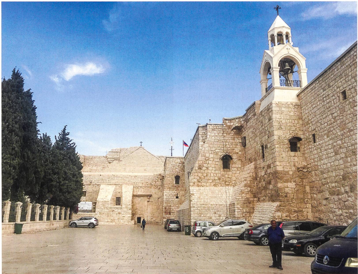
Platz vor der Geburtskirche in Bethlehem im Juni 2020 ohne die üblichen Pilgerströme.

sollte mir da auch nicht anders gehen als vielen Menschen auf der ganzen Welt.