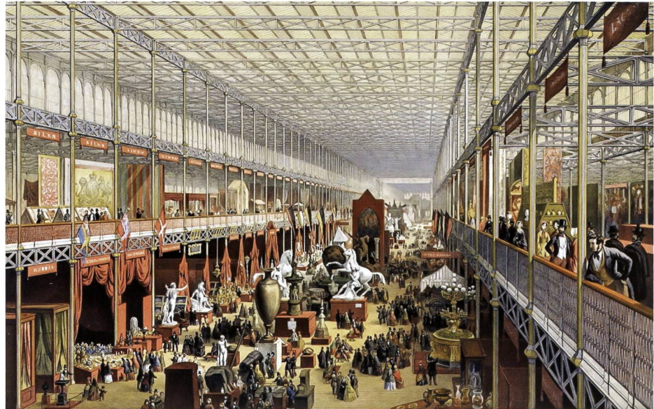
Lithographie colorée de J. McNeven illustrant l'intérieur du Crystal Palace, Hyde Park, Londres, 1851.