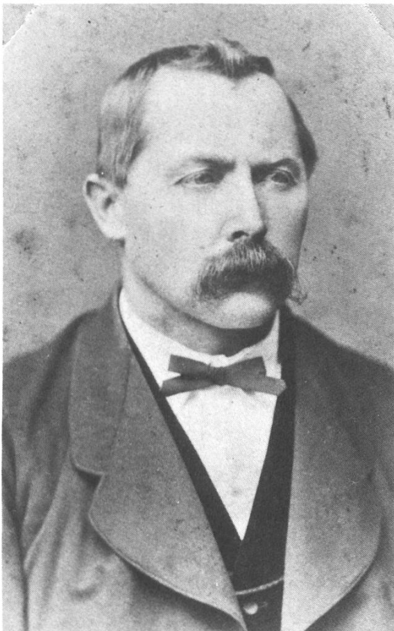
Gemeindepäsident Werner Diethelm 1835 — 1914 Metzgermeister im Bären