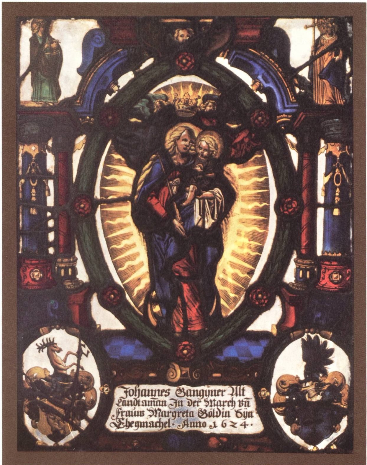
1 Wappenscheibe des Johannes Gangyner und seiner Frau Margareta Göldi, 1624. Gestiftet in die St. Jostkapelle, Galgenen (Nr. 4). Sammlung Marchring (MR 800), March-Museum (Foto: A. Jörger)