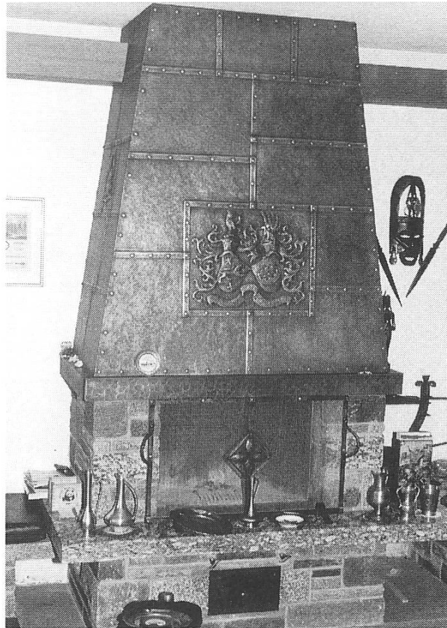
Wappen «Mettler», Reichenburg (oben links) / Cheminée mit Ehwappen, Schänis (oben rechts) / Wappen «Wick» an Balkongeländer, Kaltbrunn (unten)