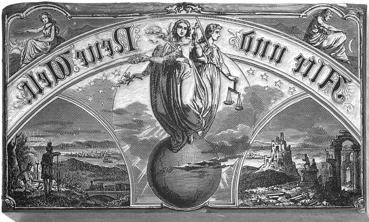
oben: Holzstock quer zur Faser seitenerkehrt gestochen. unten: Das ab Holzstock gedruckte Motiv erscheint richtig.