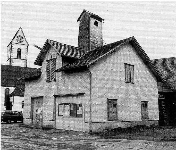
Das erste Spritzenhaus aus den frühen 1920er Jahren.