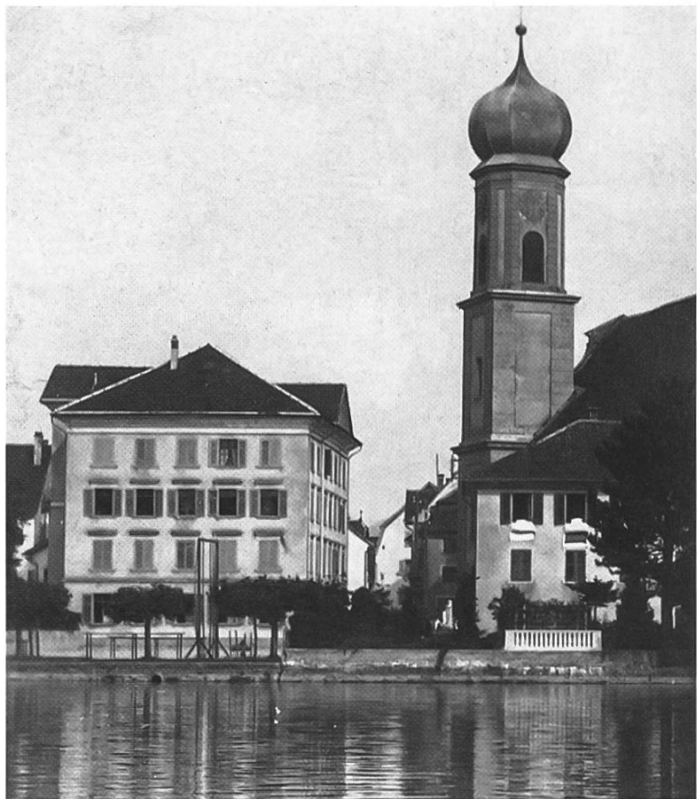
Das Alte Schulhaus neben der Kirche, ca. 1935. Auf dem Platz stehen noch die Turngeräte für die Schüler.

In dieses Schulhaus kamen 1853 auch die ersten beiden Klassen der neu gegründeten Knaben-Sekundarschule. 1898 teilte der Gemeinderat Lachen mit, dass er «gezwungen sei, eine Lehrerwohnung zu Schulzimmern umzuwandeln und wünscht von der in Ziff. 6 des Vertrages vom 1. Okt. 1852» entbunden zu werden. Er offerierte dafür eine alljährliche Wohnungsentschädigung von 250 Franken.