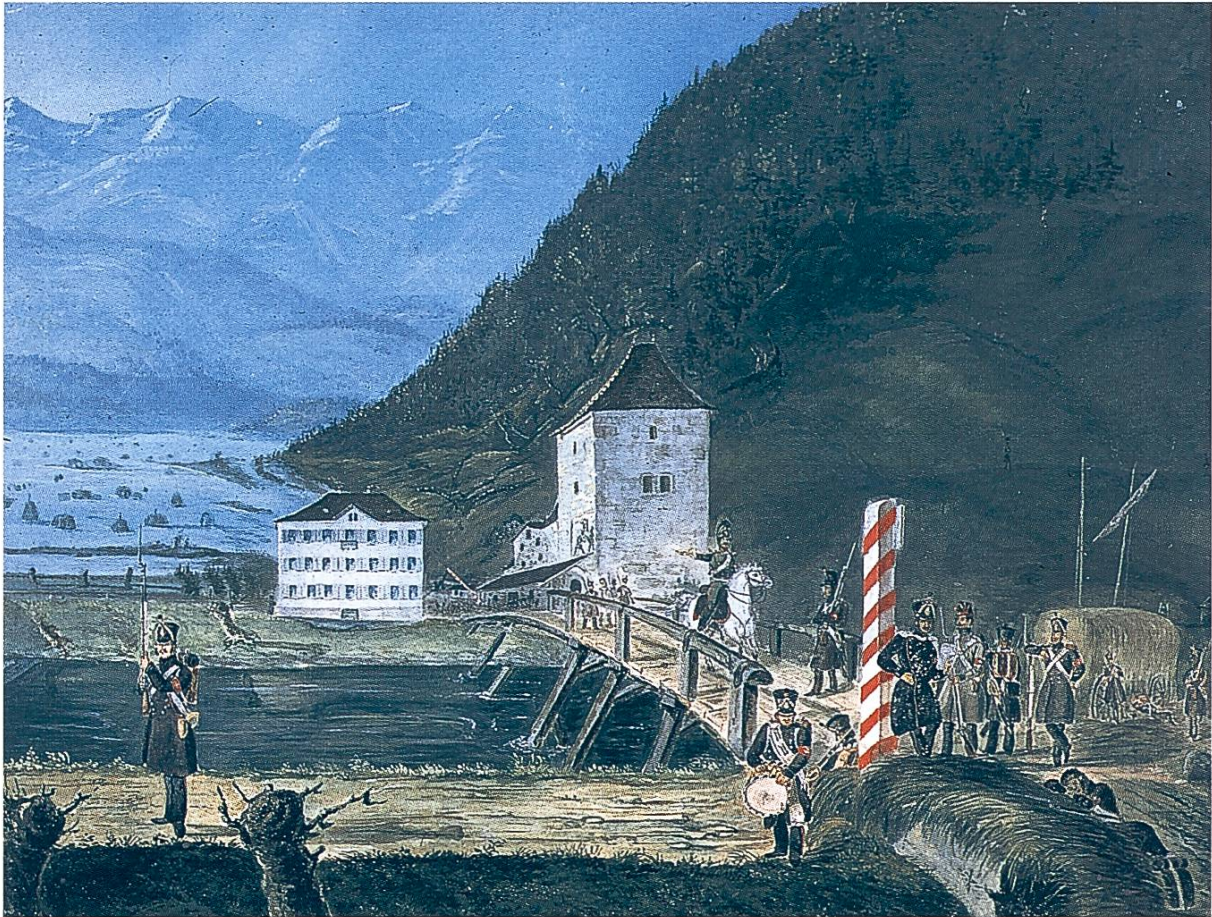
Die 1833 von eidgenössischen Truppen besetzte Brücke über den Linthkanal in Grinau; im Hintergrund die überschwemmte Linthebene bei Tuggen. Gemälde von Unbekannt (Punktum Bildarchiv, Zürich).

und Uferbauten gefährden. Dabei ist in erster Linie an die direkte Untergrabung der Gründungen zu denken, aber auch an Kolkungen durch veränderte Strömungen. In zweiter Linie hätten sich grössere und bleibende Spiegelabsenkungen grundsätzlich für alle Ufer destabilisierend bemerkbar gemacht – nicht nur in Zürich, sondern am gesamten Seeufer. Wegen diesen Gefahren galt es, behutsam und in kleinen Schritten vorzugehen.