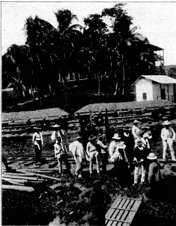
Puerto Berrio. Gare et débarcadère. (F. M.)

Puerto Berrio (alt. 143 m.) est un village qui n'a d'importance que parce qu'il est le point terminus du chemin de fer qui aboutira un jour à Medellin. Comme dans toute la vallée du