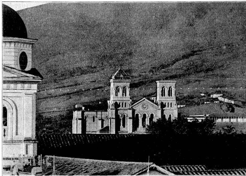
La cathédrale de Medellin. (Vue prise au téléphot Vautier).

Sous la conduite du vénérable vieillard, nous pouvons tout admirer à loisir en recueillant de sa bouche les renseignements les plus intéressants. Ces antiquités proviennent surtout de la vallée du Cauca, plus spécialement des provinces d'Antioquia et du Cauca et forment une collection très riche en poteries et en objets d'or de l'époque pré-espagnole. Les poteries, au nombre de plusieurs centaines, sont presque toutes en terre noire, décorées de dessins à l'ocre. Elles représentent surtout des animaux, en particulier des grenouilles, salamandres et serpents, parfois aussi des singes, ours, tapirs, etc. Nous sommes frappés par quelques vases ayant la forme de véritables bêtes apocalyptiques et rappelant les gravures quelque peu fantaisistes des zoologistes du xvi e siècle. Nombreuses sont les poteries à figure humaine au type mongol très nettement marqué. Il y a aussi des vases présentant une ou deux ouvertures permettant de s'en