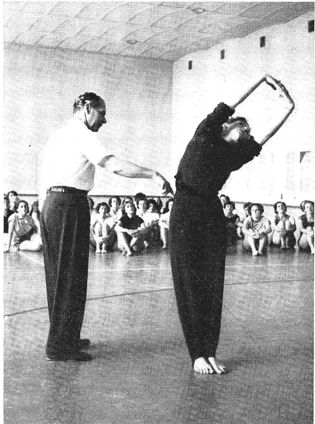
«Isolierte Bewegung». Demonstration am lebenden Modell.