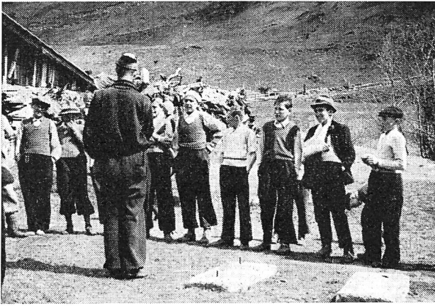
Auch einer in schwierigen Verhältnissen...

nächste Waldrand stand uns hiefür in 15 Minuten gratis zur Verfügung, ebenso zum Klettern, zu Frei- und Bodenübungen und zum Spielen. Längere Zeit warfen wir auch auf der abgemähten Matte eines Bauern, der uns diese nach freundlicher Anfrage jeweils zur Verfügung stellte.