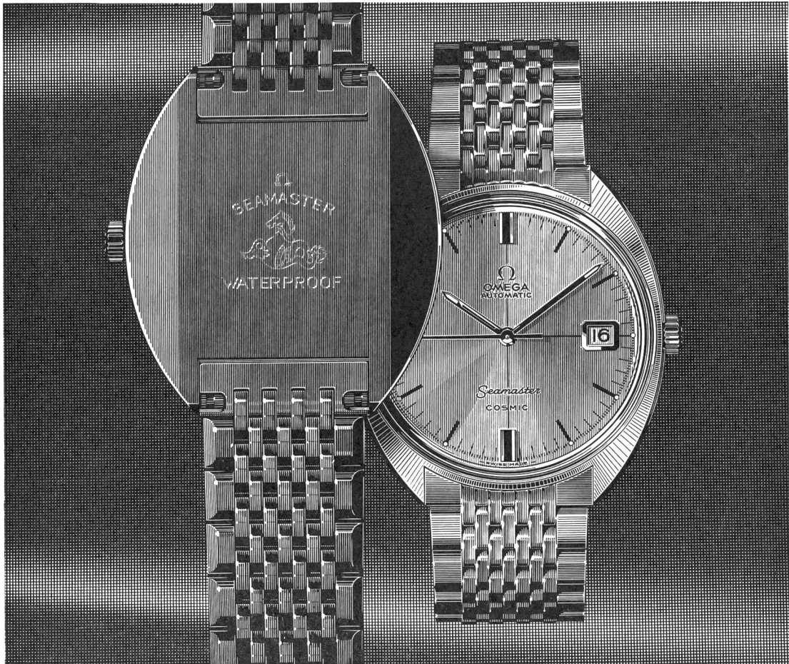
La Seamaster Cosmic: Etanche, calendrier, remontage automatique ou manuel Omega-Seamaster Cosmic: Wasserdicht, Kalender, automatisch oder mit Handaufzug