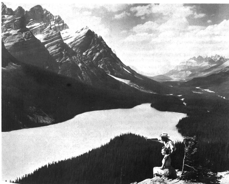
Im Banff Nationalpark, Alberta, Kanada.

Bei den Indianern würdest du «Sonnenstrahl im Walde» oder «Leuchtender Stern der Nacht» heissen; oder «Schwellende Knospe der Freude». Sicher «Schwellende Knospe der Freude». Aber auch Jennifer ist schön; nur passt es nicht für deine braunen Wangen und breiten Schultern, kleine Waldläuferin.