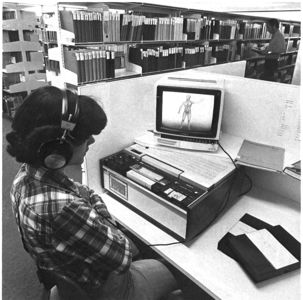
Studienkoje mit Video-Abspielgerät und Monitor.

Der Benutzer gelangt an uns mit der Bitte um Ausleihe eines Films. Ist der Titel des gewünschten Films bekannt, prüfen wir anhand der Terminkontrolle, ob der Film am Vorführdatum verfügbar ist. Ist dies der Fall, so wird dem Benutzer das AVM-Bestellformular zugestellt. Der gewünschte Film ist provisorisch reserviert. Der Benutzer füllt das Bestellformular aus und bestellt definitiv. Er erhält eine Auftragsbestätigung. Zwei Tage vor der datierten Filmvorführung wird der bestellte Film per Express unter Beilage des Lieferscheins abgeschickt. Der Leihschein gilt als Quittung und wird unter dem Namen des Entleihers abgestellt. Unmittelbar nach der Filmvorführung hat die Rückgabe beziehungsweise Rücksendung per Express zu erfolgen. Jede Filmrückgabe/Rücksendung wird auf dem elektronisch gesteuerten Kontrollgerät auf Beschädigung untersucht. Verläuft diese Kontrolle ohne Beanstandung, so ist der Film für die weitere Ausleihe freigegeben. Kleinere Reparaturen werden bei dieser Filmkontrolle vor-