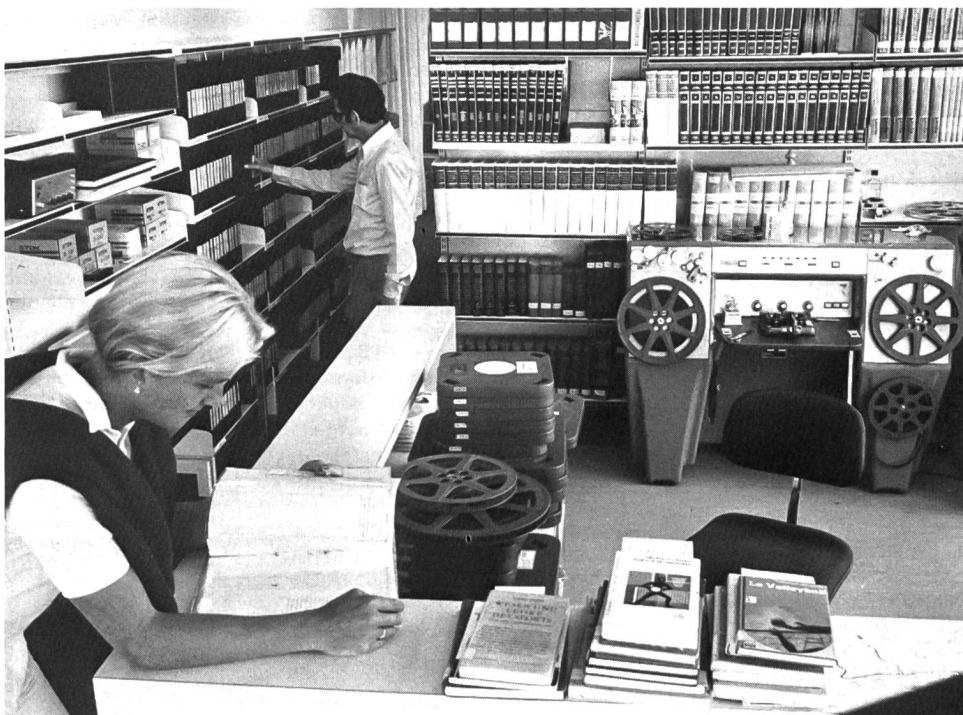
Ausleihe mit Filmkontrollstelle.

Der Sport und die Sportwissenschaft bedienen sich seitdem sie die Bedeutung der audiovisuellen Medien (AVM) für Unterricht und Forschung erkannt haben dieser neuzeitlichen Informationsträger. Am Anfang waren es einige Lehrer, die für ihren speziellen Unterrichtsbe- reich AVM erwerben liessen. Durch diese «halbprivate» Erwerbung und die persönliche Zuteilung, wurde die Erschliessung der AVM vernachlässigt und die Nutzbarmachung praktisch verunmöglicht. Technische Kontrollen auf Beschädigungen blieben unterlassen; Kontrollen auf Vollständigkeit fehlten. Unbrauchbarkeit und Verluste von AVM mussten zwangsläufig dazu führen, dass Erwerbung, Erschliessung und Nutzbarmachung der Stelle anvertraut wurde, die in spezifisch bibliothekarischen Belan- gen Erfahrung besass. Und diese Stelle war eben die Bibliothek. Heute, nach etwas mehr als zweijährigem Zusammenleben von Biblio- thek + Mediothek, ist die Mediothek nicht mehr von der Bibliothek wegzudenken. Die Bibliothek hat durch die Zusammenlegung an Bedeutung gewonnen, ihre Dienstleistungen sind umfas- sender geworden. Der Benutzer findet alle In- formationsträger in der selben Abteilung. Die Bi- bliothek-Mediothek ist zu einem eigentlichen Begegnungszentrum geworden oder ist auf dem Weg ein solches zu werden.