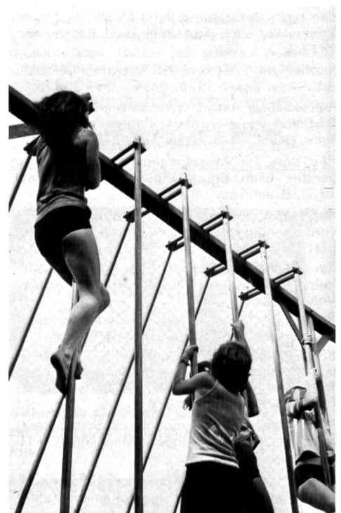
Auch die Mädchen können zum grossen Teil gut klettern.