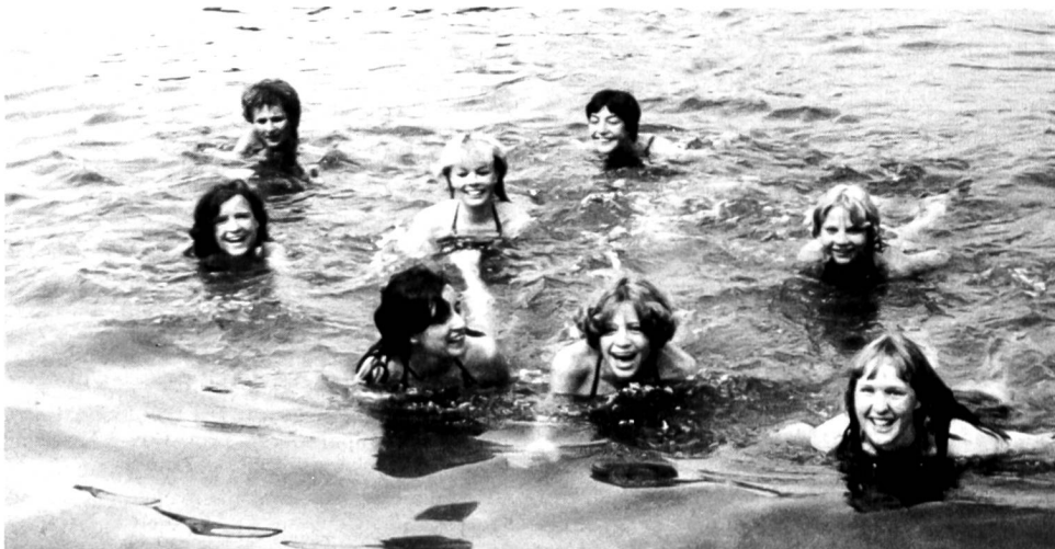
Ein kühles Bad im See ist immer sehr erwünscht.

Vor zehn Jahren, noch während der Versuchsphase von J+S mit 50 Teilnehmerinnen probeweise gestartet, erfreute sich dieses Sportlager seither immer grösserer Beliebtheit und konnte bereits im fünften Jahr auf das heutige Ausmass von 100 Teilnehmerinnen gebracht werden. Diese stammen aus den Mädchen- und Damenriegen des ganzen Kantons. Es darf festgestellt werden, dass diese Sportwoche eine grosse Ausstrahlung besitzt. So sind in den letzten Jahren viele junge begeisterte Turnerinnen dieser Lager in ihren Riegen und Vereinen daheim als Leiterinnen tätig geworden. Dazu kommt, dass immer wieder «Tenero»-Teilnehmerinnen motiviert werden können, um eine J+S-Leiterausstellung zu beginnen. Auch im Leiterteam dieses Sportlagers stecken bereits ehemalige Lagerteilnehmerinnen.