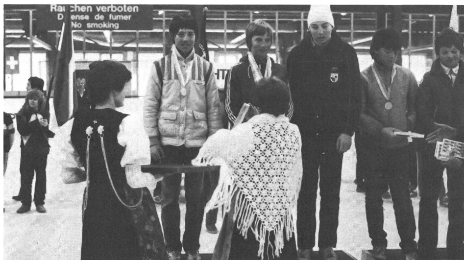
«Medaillensegen» auf dem Treppchen. Spiel, Prestige oder Triumph des Gegeneinander?

Und da scheint doch ein ehrlicher Ansatz zu sinnvoller Förderung junger Skitalente zu sein. Auch der Schweizerische Skiverband hat die Zeichen für einen kindgemässen Leistungssport erkannt. ■