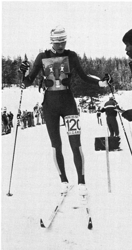
Startbild anlässlich der Ski-OL-Weltmeisterschaften in Bulgarien 1985.

form nur noch lächeln. Mit der technischen Entwicklung, sei es im Skisektor oder im Bereich der Loipenspurgeräte, aber auch bei den OL-Karten, hat sich der Ski-OL in Skandinavien zu einer ernstzunehmenden Sportart gewandelt.