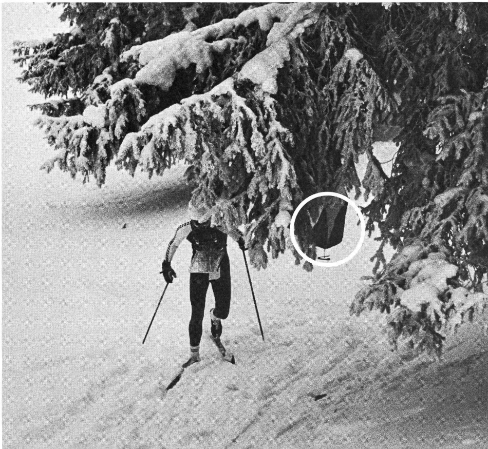
Im Ski-OL sind die Posten (auf dem Bild eingekreist) allgemein leichter aufzufinden als beim «normalen» OL. Sie liegen zumeist an Loipenkreuzungen oder markanten Geländepunkten.

Am ehesten geeignet sind die flacheren Gebiete des Jura, wo es möglich wäre, ein weitverzweigtes Loipennetz anzulegen. Hier stellt sich aber in erster Linie die Frage des Aufwandes und der Verhältnismässigkeit, beteiligen sich doch meist nur einige Dutzend Wettkampf-Teilnehmer.