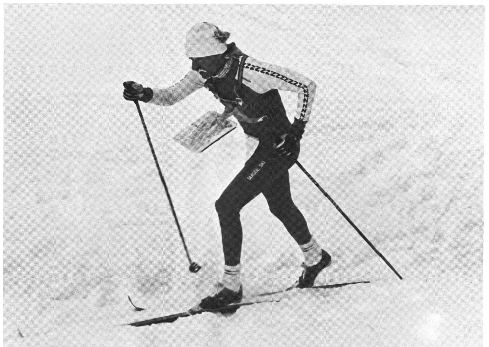
Ein Ski-Orientierungsläufer unterwegs mit gut sichtbarem tragbarem Schreibpult. Das Bild vermittelt die ganze Härte dieses in der Schweiz nur wenig verbreiteten Ausdauersports.

wohl auf einem gepflügten Weg oder einer Doppelspur skaten, aber auf einer gewöhnlichen Skispur wird er mit dem Diagonalschritt besser beraten sein. Es kann auch vorkommen, dass es die Verhältnisse erfordern, zu Fuss zu gehen. Dies ist im Gegensatz zum Langlauf beim Ski-OL erlaubt.