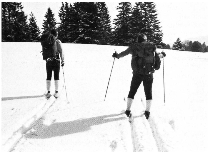
Links eine zu schmale, rechts eine scheinbar zu breite Spur.

Ziehe ich allein im Tiefschnee eine Spur, spielt es keine Rolle, wie breit ich die Spur lege. Bin ich an der Spitze einer Gruppe, sieht das etwas anders aus. Die Spur sollte auch noch für den hintersten hüftbreit sein und einen Mittelgrat haben, der die Ski auch innen führt. In einer zu schmalen Spur können sich Schuh/ Bindungen verhaken, und mit einem schweren Rucksack wird es schwierig, das Gleichgewicht zu behalten. Es ist deshalb wichtig, dass der Spurmänn eine genügend breite Spur anlegt – für sein Empfinden muss er zu breit gehen –, damit für die hinteren Wanderer die Spurbreite gerade richtig wird.