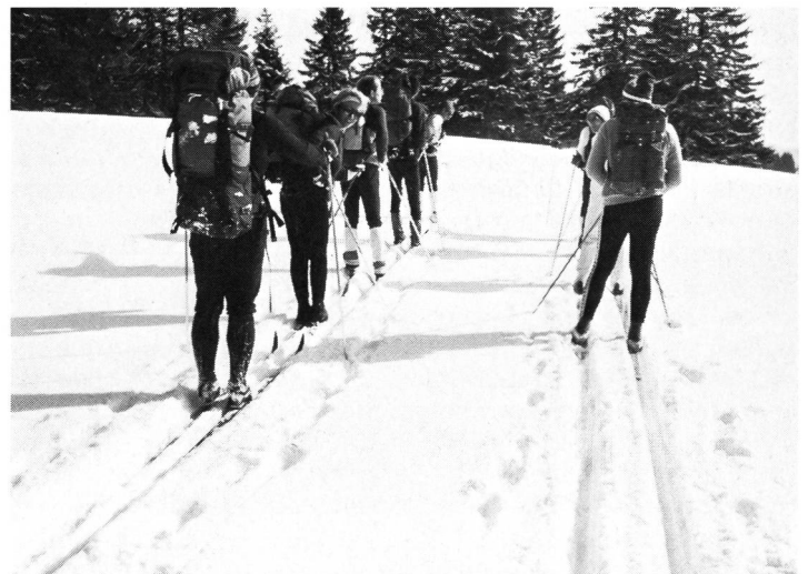
Links: Zu enge Spur, rechts (richtig) hüftbreite Wanderspur.