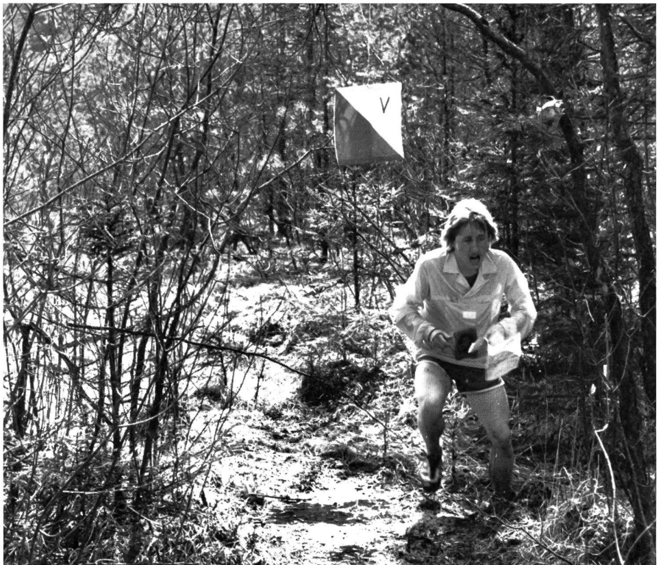
OL-Sport: in und mit der Natur!

Mit grossem Interesse habe ich den Artikel «Fairness im Sport – auch gegenüber der Natur» (MAGGLINGEN Nr. 12) gelesen. Ich gehe mit Ihnen einig, dass das Spannungsfeld Sport und Umwelt für viele Sportarten immer mehr zu einem zentralen Problem werden wird, und als Präsident des Schweizerischen Orientierungslauf-Verbandes (SOLV) begrüsse ich das Luzerner Modell der Zusammenarbeit zwischen den verschiedenen Waldbenützern. Wir kennen diese Koordinationsgespräche auch in verschiedenen andern Kantonen, und es ist unser Ziel, diese auf alle Gebiete auszudehnen. Eine Differenzierung zum neuen Waldgesetz scheint mir aber unerlässlich. Sie schreiben: «Es sollte auch für die Veranstalter Beruhigung sein, wenn im neuen Waldgesetz mit einem Bewilligungsverfahren grössere Veranstaltungen im Walde geregelt werden.» Wohlan, das wäre für den SOLV eine Diskussionsbasis.