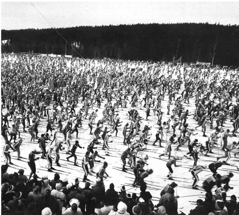
Der Vasa-Lauf mit über 12 000 Teilnehmern ist Schwedens Aushängeschild im Sport. (Keystone)

Aus: Institut für Sozial- und Präventivmedizin der Universität Zürich Gloriastrasse 32, 8006 Zürich