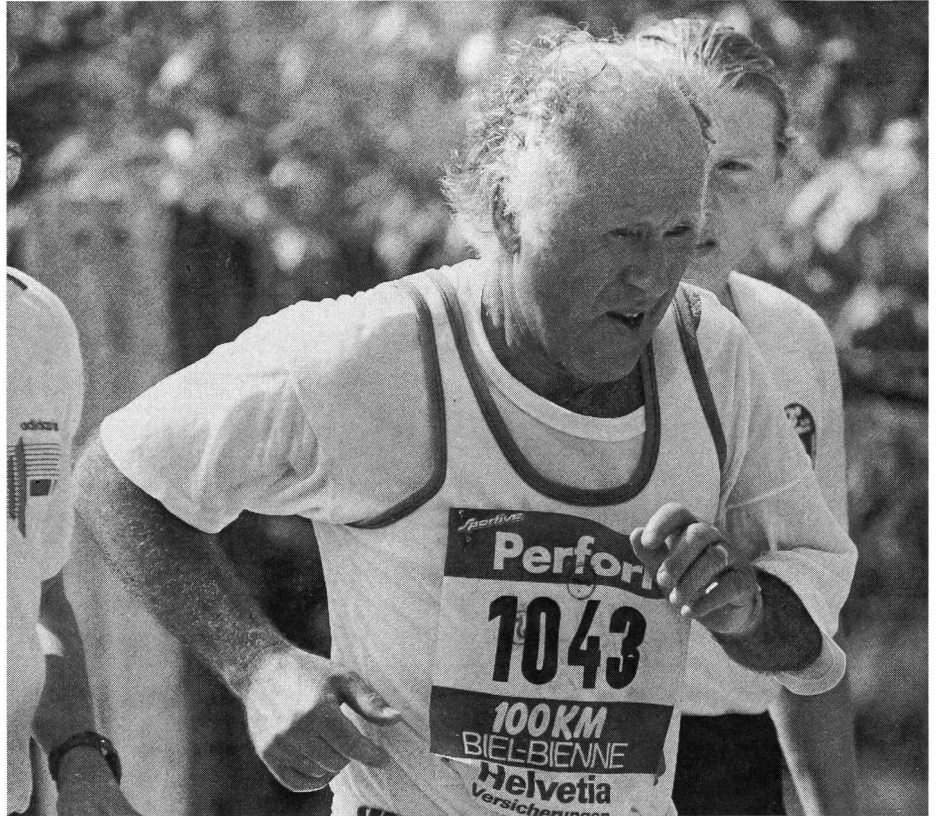
Gutes Training vorausgesetzt liegt sogar ein «Hunderter» drinn.

Der Seniorensport ist zu einer nationalen Aufgabe geworden, die nur in Zusammenarbeit aller und mit der uneingeschränkten Bereitschaft zur Mithilfe, einer harmonischen Verwirklichung zugeführt werden kann. Er ist so für alle Interessierten zu einer echten Herausforderung geworden. ■