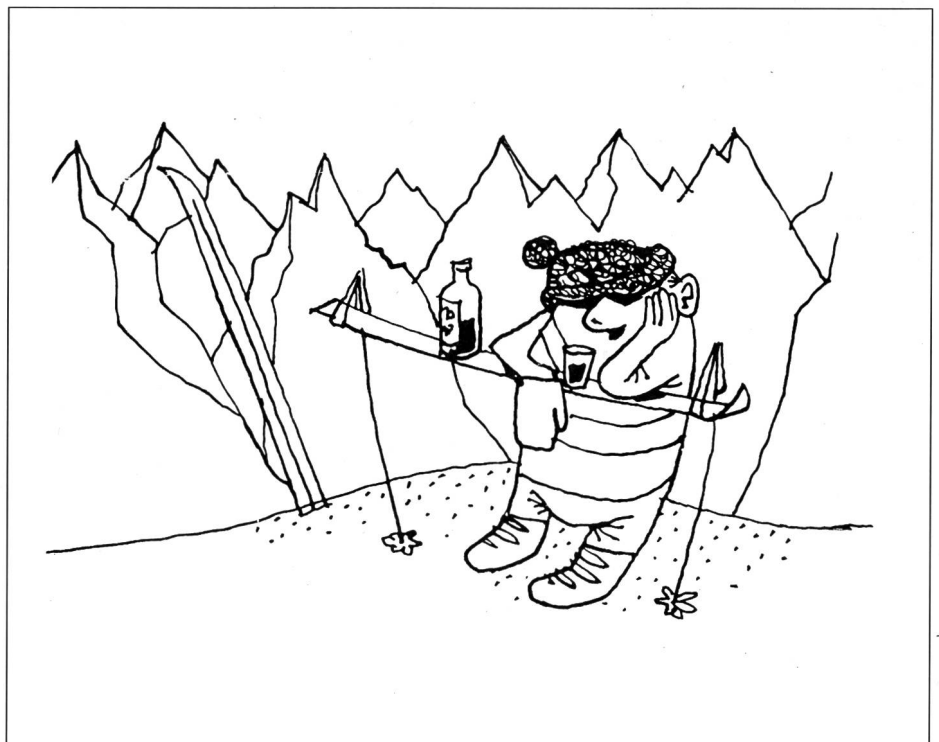
Aus «SKI-zophren» von Ernst Hürlimann.

Die SFA-Untersuchung zeigt aber auch, dass der Alkoholkonsum der Jugendlichen im Vergleich zu 1978 abgenommen hat. Die Zahl der Schüler, die wö-