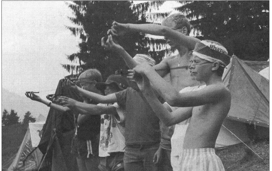
Orientierungs- und Erkundungsübung im Lagergelände.