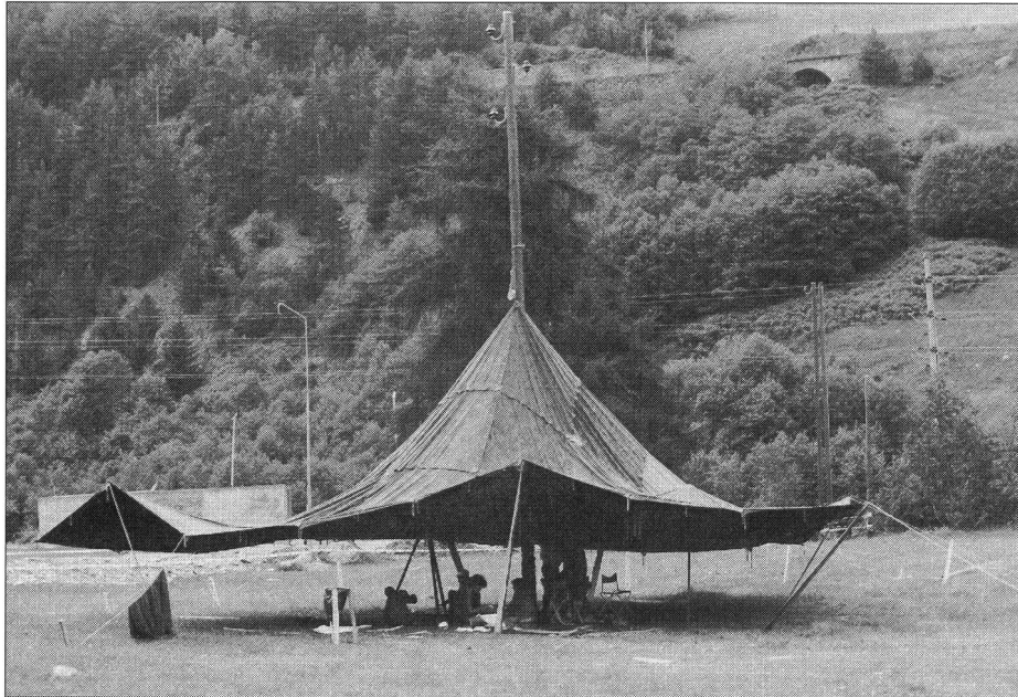
Unglaublich aber wahr: Ein Sarassanizelt am Stromleitungsmast befestigt.