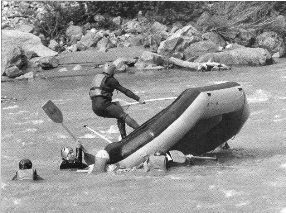
Ein Flipp (Kentern) will geübt sein. Als erstes gilt es, das Boot im Wasser aufzurichten.

ein methodisch-didaktisch durchdachter Unterricht zuteil wird. Ein solcher unterscheidet sich wesentlich vom Raften mit beispielsweise eher passiven Erwachsenen als Passagiere und verlangt differenziertes Vorgehen. Die Leiter müssen neben persönlichen Fähigkeiten auch Sicherheitstechniken und Verhaltensnormen kennen und stufengerecht vermitteln können. Jugend + Sport möchte zu einer sportlich sinnvollen und umweltbewussten Entwicklung des River-Raftings beitragen. ■